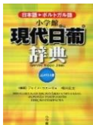
Dicionário de japonês para português